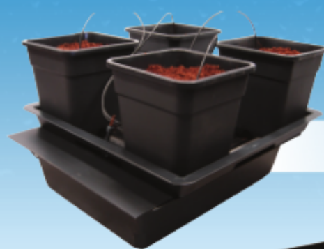
Wilma BIG 4