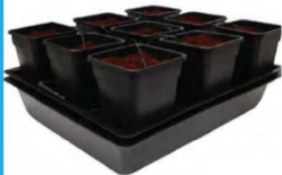
Systém Wilma Se Dodává V 8 Velikostech